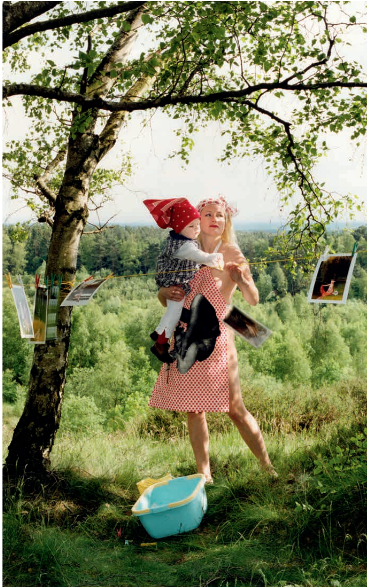
Katharina Bosse, aus der Serie A Portrait of the Artist as a Young Mother , 2004–2009, C-Prints, je 160 x 125 cm, © Katharina Bosse

So, 16.10./20.11., jeweils 10.30–12.30 Uhr Start: Foyer Germanisches Nationalmuseum