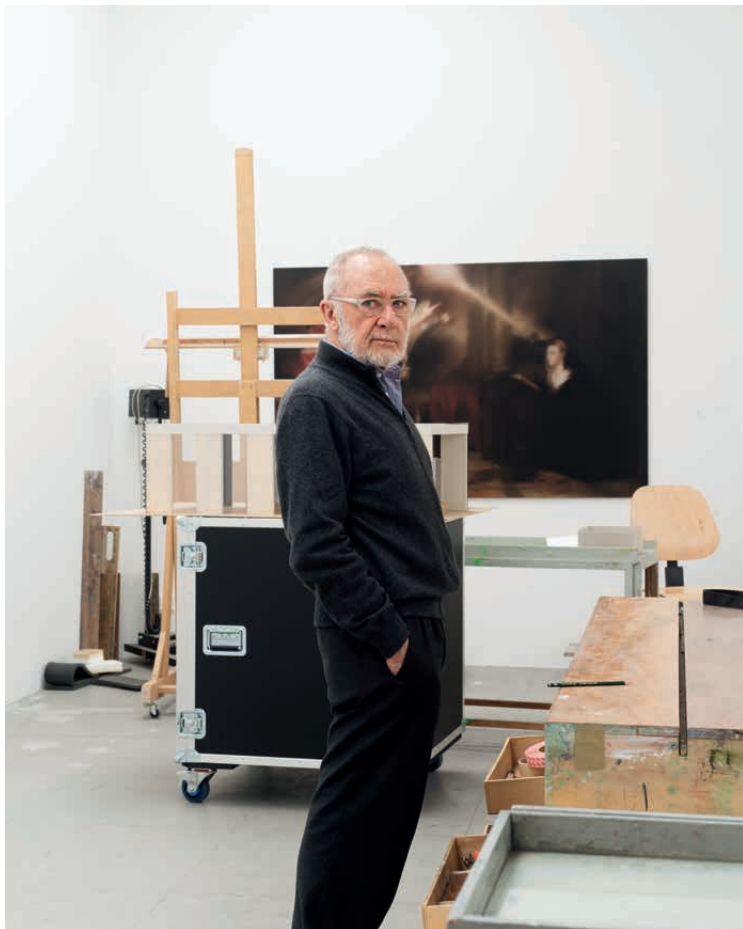
Albrecht Fuchs, Gerhard Richter , Köln 2015, C-Print, 37,4 x 30,5 cm

Jeden Sonntag, jeweils 11 Uhr Start: Kunsthalle