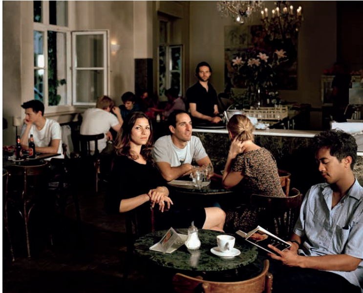
Jana Kölmel, Kaffeehaus , 2011, aus der Serie Insenierte Fotografien , 2009–2011, Digitaldruck, 90 x 110 cm, © Jana Kölmel